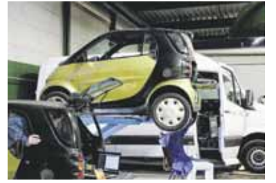
Pagina 10 Samen innoveren