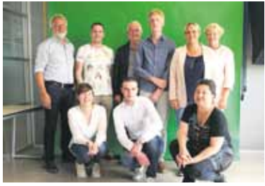
Pagina 4 Rondetafelsessie

Sinds 1 januari 2016 is Nederland een betekenisvol initiatief rijker: het Netwerk burgerschap mbo. Een kennismaking.