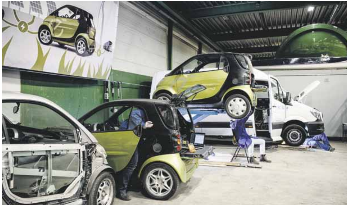
Een van de bekendste innovatiebroedplaatsen is het HighTechCentreDelft. Hier investeren ROC Mondriaan en Wellant College met partners uit het onderwijs, bedrijfsleven en overheid in het opleiden en scholen van nieuwe en huidige werknemers.